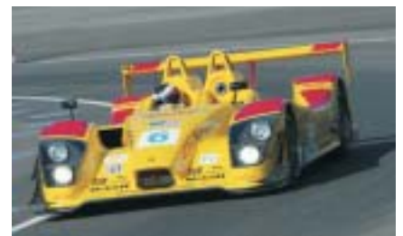
Die Herausforderung 2006: die Teilnahme in der American Le Mans Series mit dem neuen Porsche RS Spyder.