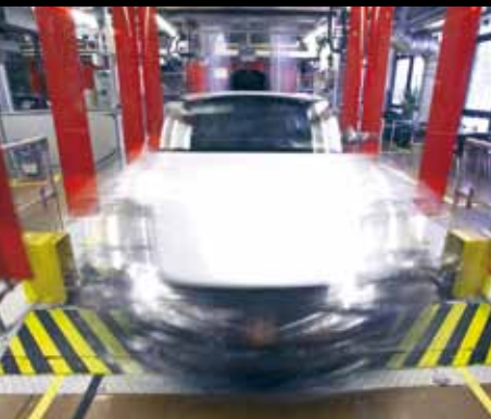
Ein Porsche Cayman S auf dem Fahrwerkprüfstand.