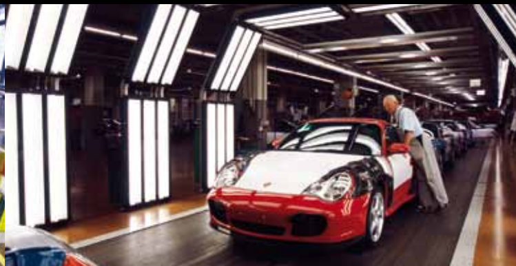
Im Lichttunnel wird die Lackierung geprüft.

„Man kann sich ein Fahrzeug als Orchester von tausend Einzelteilen vorstellen. Wir überwachen die Harmonie des Ganzen und spüren Dissonanzen auf. Das ist eine große Verantwortung.“