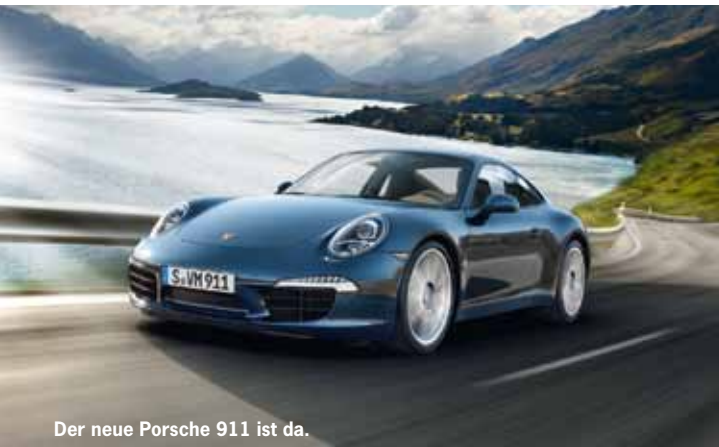
Der neue Porsche 911 ist da.