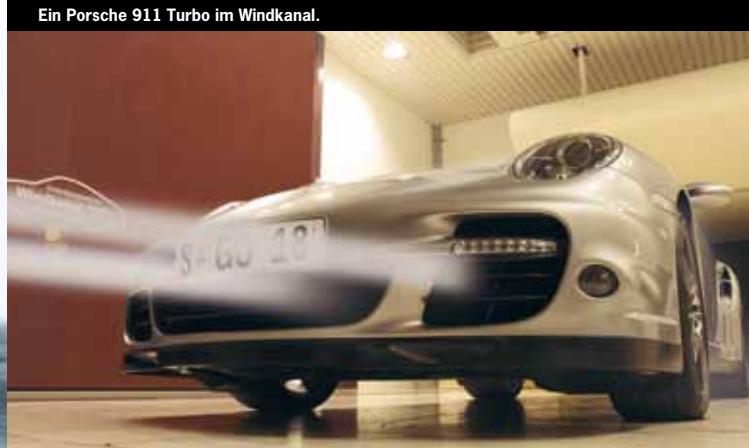
Ein Porsche 911 Turbo im Windkanal.