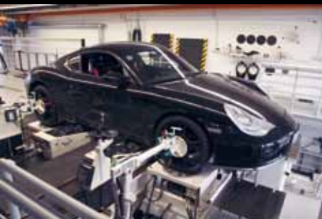
Messtechnik zur Fahrwerk-Erprobung.