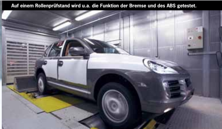
Auf einem Rollenprüfstand wird u.a. die Funktion der Bremse und des ABS getestet.