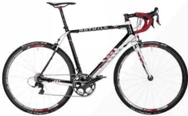
► R.S2 EDITION