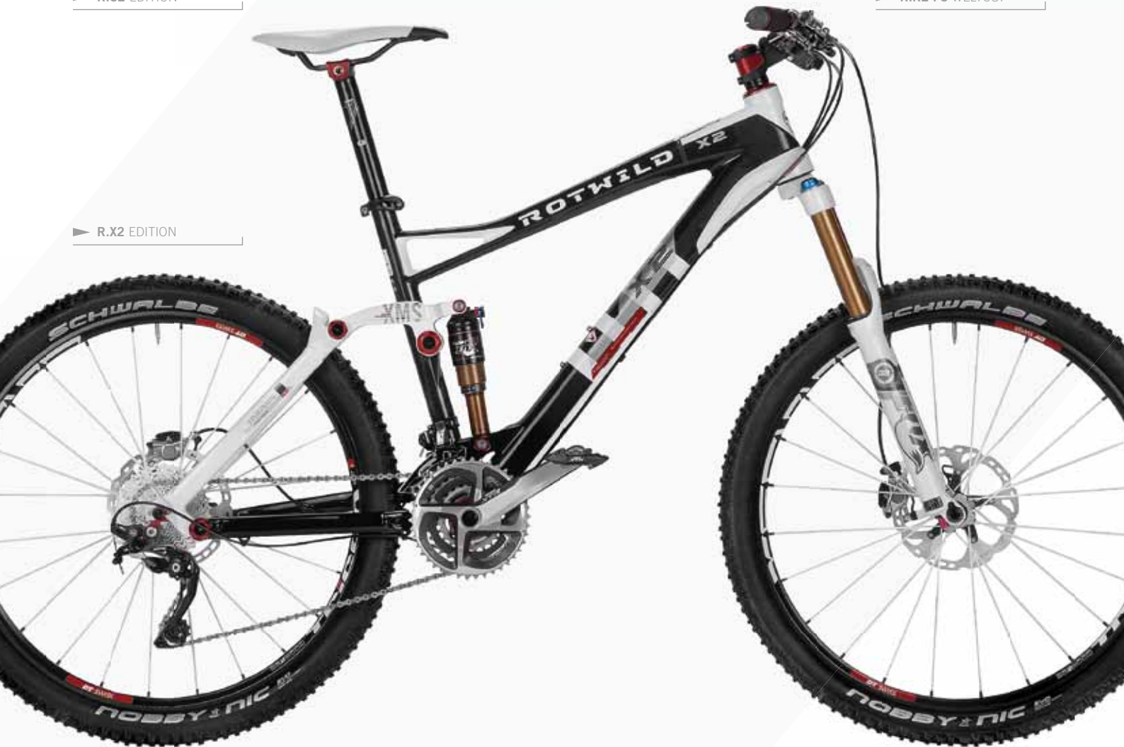
► R.X2 EDITION