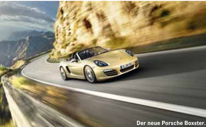
Der neue Porsche Boxster.