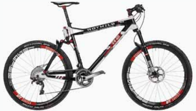
► R.R2 FS WELTCUP