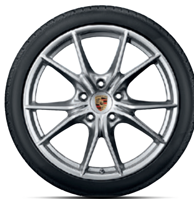
20-Zoll Carrera S Rad

Erhältlich für 718 Boxster und 718 Boxster S sowie 718 Cayman und 718 Cayman S.