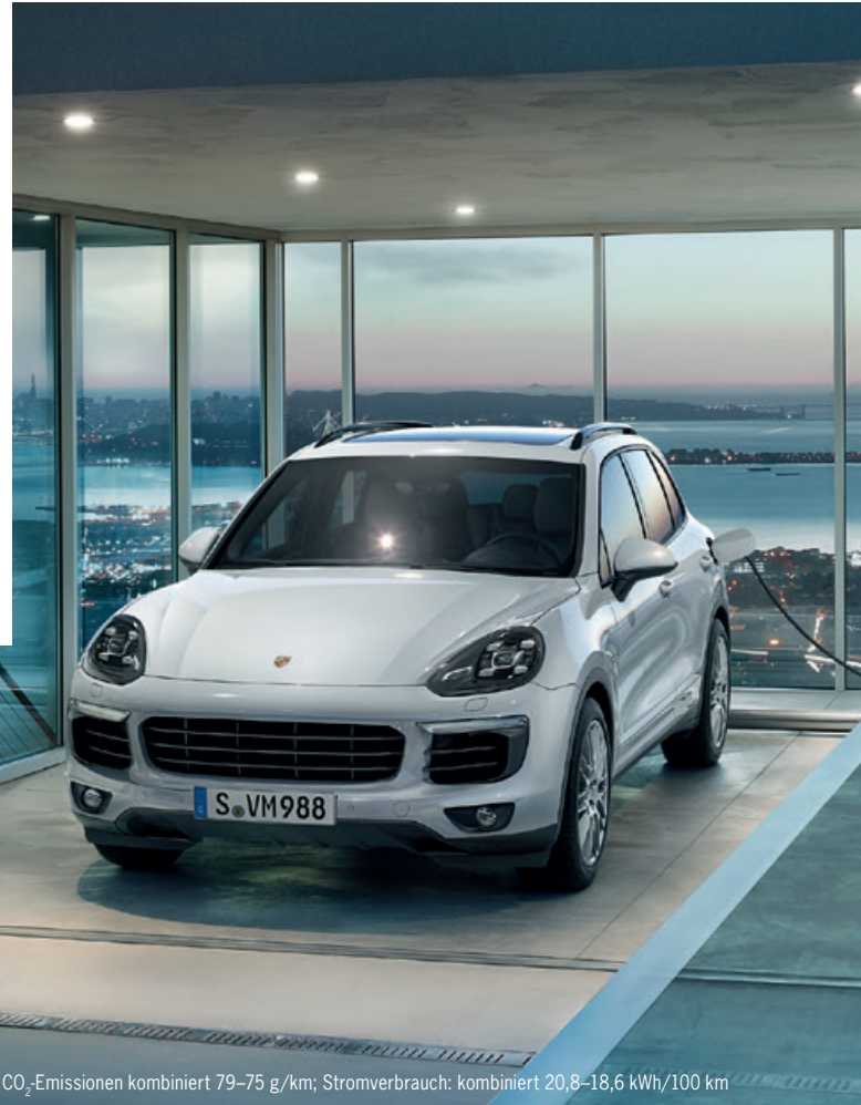
Porsche Cayenne S E-Hybrid · Kraftstoffverbrauch (in l/100 km): kombiniert 3,4–3,3; CO 2 -Emissionen kombiniert 79–75 g/km; Stromverbrauch: kombiniert 20,8–18,6 kWh/100 km

Mit Porsche E-Performance formulieren wir schon heute Antworten auf die Fragen von morgen, und setzen dort an, wo wir tatsächlich etwas verändern können: in der Garage, im Alltag unserer Fahrer – mit einem durchdachten Gesamtkonzept, das die Bereiche Fahrzeug, Energie und Konnektivität umfasst.