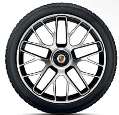
20-Zoll 911 Turbo S Rad

Erhältlich für alle 911 Carrera/S (991 II). In anderen Abmessungen erhältlich für 911 Carrera 4/4S (991 II) und 911 Turbo/S (991 II). Auch erhältlich in Platinum (seidenglanz).