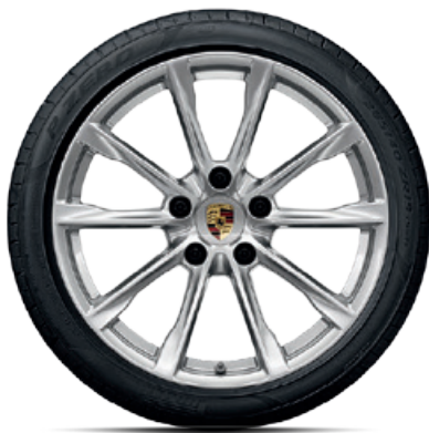
19-Zoll Boxster S Rad

Die Winterkomplettträger von Porsche Tequipment sind 100 % Porsche. Und hinsichtlich Fahrperformance, Handling, Rollwiderstand und Gewicht optimiert. Für sie gilt dasselbe, wie bei der Fahrzeugentwicklung: Alles dreht sich um Sportlichkeit. Dass sie Ihren Porsche dabei gut aussehen lassen, ist kein Wunder, sondern logische Konsequenz. Für Ihren Porsche heißt das: Der Winter kann kommen. Mit Eis und Schnee für die Straße – mit Sicherheit und Fahrspaß für Sie.