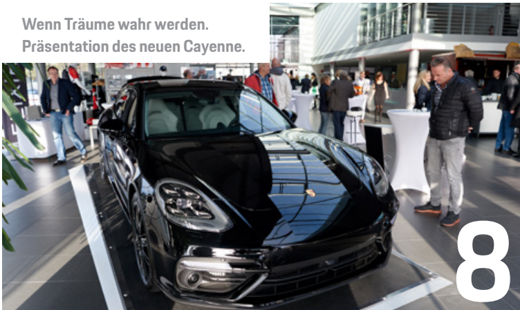
Wenn Träume wahr werden. Präsentation des neuen Cayenne.