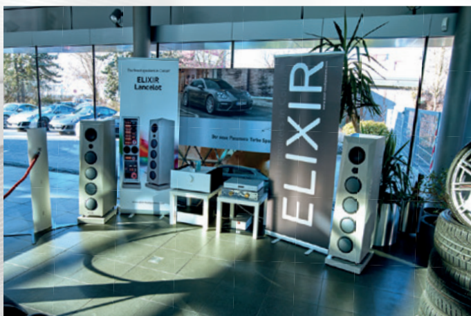
Ein perfektes Duo: Das Porschezentrum Darmstadt und Elixir®

Elixir®-Loudspeakers werden in Darmstadt in reiner Manufakturarbeit hergestellt. Das besondere Kennzeichen der Lautsprecher aus dem Luxussegment ist das Gehäuse aus Corian® - dem weltbekannten Kunststein. So gut wie alle Farben sind hier nach Wunsch erhältlich. Die techni-